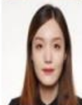
Foto não pode estar distorcida