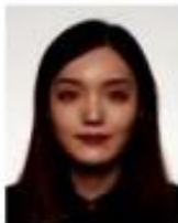
Foto deve ser clara e bem definida com luz suficiente

O rosto não pode ser obstruído por nenhum objeto.