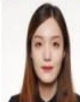
Foto não pode estar distorcida